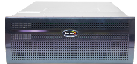
Spectra BlackPearl NAS

Markus Blesgen, IT-Betrieb, Spiegel Verlag