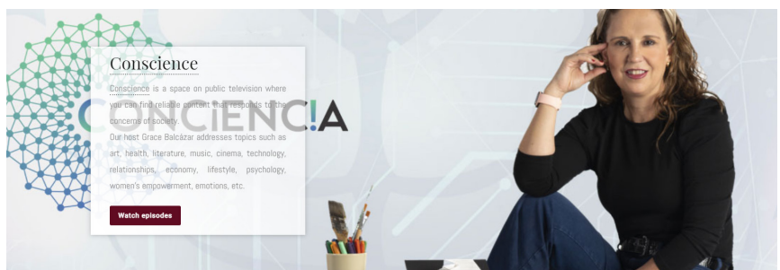
Programas como 'Conciencia' ofrecen programación educativa que responde a las preocupaciones de la sociedad en Puebla.

Con la ayuda de Comtelsat, empresa integradora de soluciones. Televisión de Puebla decidió implementar el software de administración de almacenamiento StorCycle®, el sistema de almacenamiento en objeto BlackPearl®, y la librería de